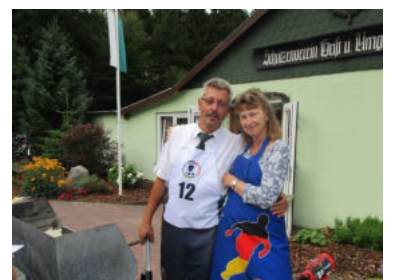
Abends gibt's noch 'ne Bratwurst vom Grill