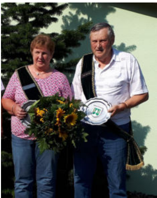
Unser amtierendes Seniorenkönigspaar