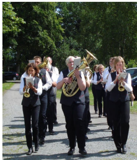
Manchmal kommt sogar der Blasmusikzug Wingst