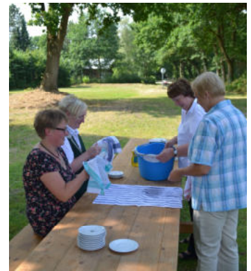
Der Abwasch ist schnell erledigt