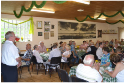
Ein herzliches Willkommen in der vollbesetzten Schießhalle