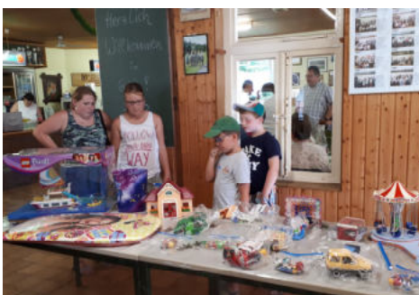
Auch die Kinder haben ihren Spaß