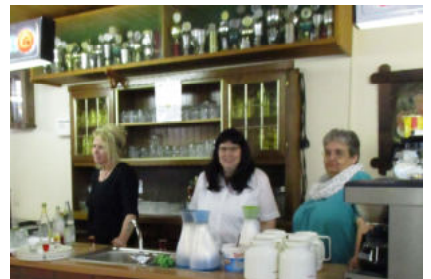
Der Tresendienst ist bereit