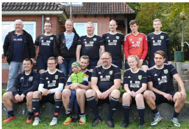
Der 'Präsi' mit der siegreichen Mannschaft (nebst Nachwuchs)