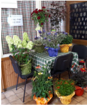
Tolle Preise auf der Blumenscheibe