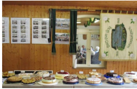
Das Tortenbuffet ist gut bestückt